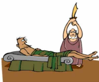
Figura 1. Procusto cortando la cabeza o los pies, para ajustar a los demás a sus deseos.

Aunado al tema de la pérdida de identidad, enfrentamos otro igual de grave. La ciencia reclama modernidad y no está del todo equivocada; pero la modernidad solicitada casi siempre significa alianza y convivencia placentera con lo convencional, con lo establecido 28 , y en el torbellino de información y conocimientos ofertados no sólo es realmente difícil, sino casi imposible mantenerse al margen de esta demanda sin perder la identidad, la razón de ser de la originalidad, de lo diferente, que es lo que ha sucedido con la Homeopatía en el ámbito educativo y en el de la investigación 29 , toda vez que a través de muchos esfuerzos hemos logrado que tenga un marco regulatorio y quede integrada formalmente a los sistemas educativo y de salud 30 .