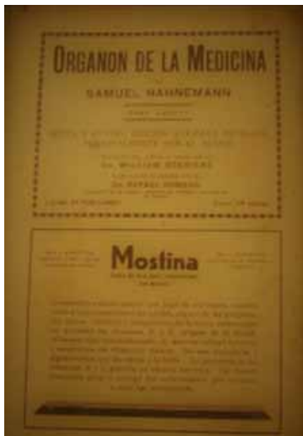
Figura 5. Anuncio del Organon de la Medicina , en la revista El Sol de Meissen .