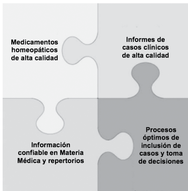
Figura 1. La cadena de calidad homeopática (© R. van Haselen).

• El MONARCH Causality Attribution Inventory 2 (Criterios MONARCH: criterios para evaluar la probabilidad de una atribución causal de la mejora observada de los síntomas y el remedio homeopático prescrito). Útil para la evaluación del tratamiento homeopático de los casos de la covid-19; también está disponible un formulario de texto correspondiente para este fin: https://www.dropbox.com/s/499eevc2pmt6o94/LMHI2020_COVID-19_MONARCH_checklist.docx .